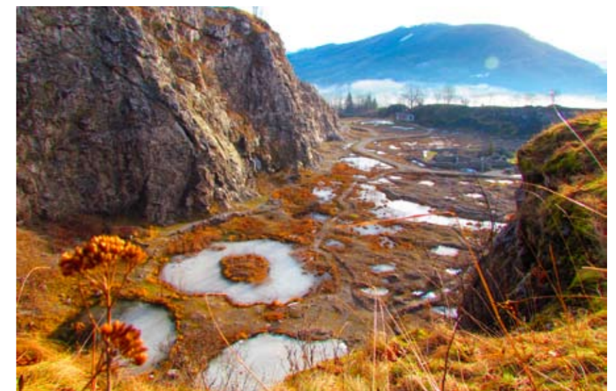
V bývalých vápencových dolech u Štramberka možná uvidíte endemického motýla jasoně červenookého, který i zde vyhybnul, ale byl znovu uměle vysazen.